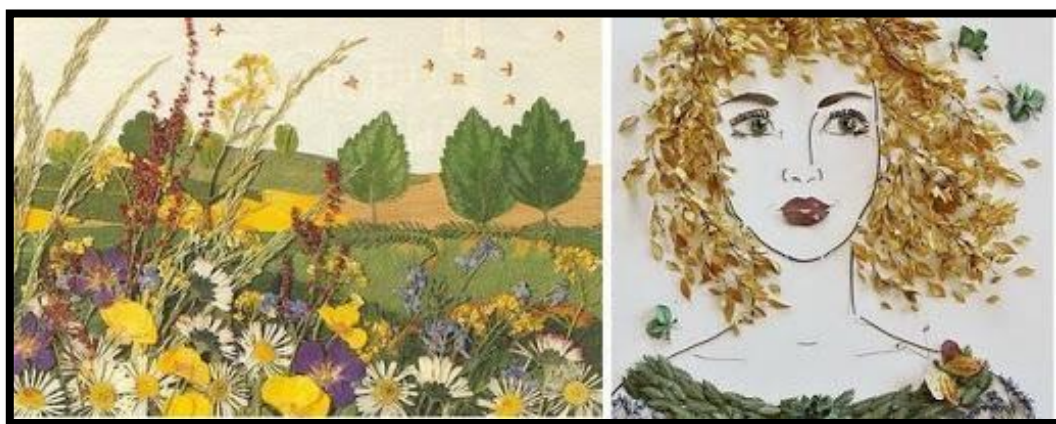
Схема. Панно из осенних листьев.